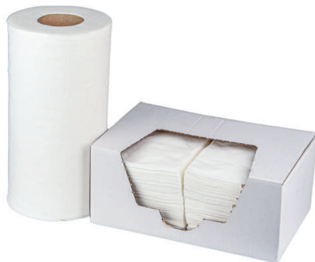
Clean Max N

Clean Max N jest elastycznym, a zarazem bardziej delikatniejszym materiałem. Dobrze działa z rozpuszczalnikami oraz zbiera trudno usuwalny brud, smar i tłuszcz.