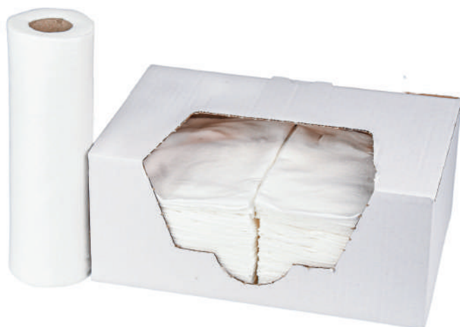
Clean Soft 45

Dobrze współpracuje z rozpuszczalnikami i doskonale zbiera olej, tłuszcz i brud. Materiał jest mocny w stanie suchym i mokrym.