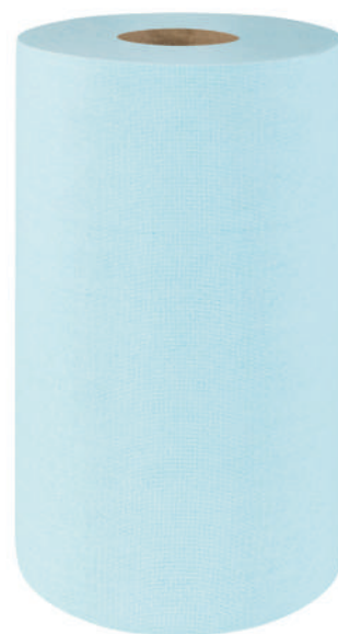
Clean Scrub Basic

Scrub Basic w kolorze turkusowym idealnie wchłania i usuwa zabrudzenia. Materiał ten jest szorstki i bardzo dobrze współpracuje z rozpuszczalnikami i doskonale zbiera olej. Jest wytrzymały i odporny na bardzo wysokie temperatury.