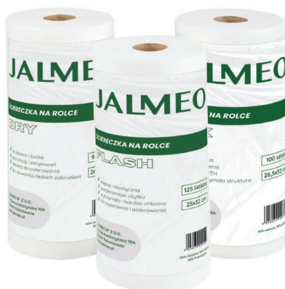
Flash / Dry / Max