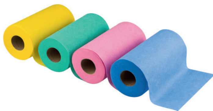
Clean Max Kolor