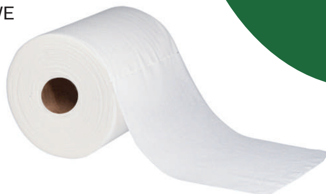
Clean Soft Plus 60

Soft Plus to czyściwo tłoczone z wypustkami, jego struktura wpływa bardzo dobrze na wycieranie, polerownie i czyszczenie powierzchni. Czyściwo te cechuje się dużą absorpcją i chłonnością, w dodatku elastyczny materiał ułatwia dotarcie do trudno dostępnych miejsc.