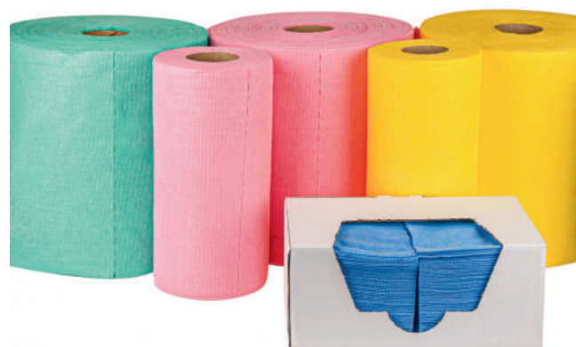
Clean Max Kolor