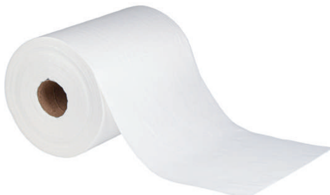
Clean Basic Plus Biały