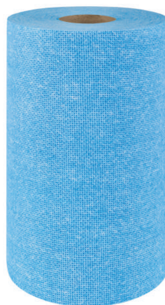
Clean Scrub Max

Jego dziurkowana struktura dobrze usuwa zabrudzenia. Jest odporny na działanie rozpuszczalników i innych substancji.