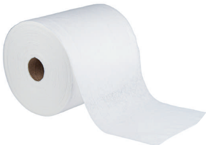
Clean Max Biały

Max Kolor jest dostępny w 4 kolorach: niebieski, zielony, różowy, żółty.