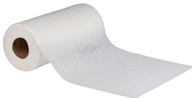
Clean Max 55gr.

Max 55 gram posiada w swoim składzie 60% wiskozy i 40% poliestru. Występuje w kolorze białym, jest bardzo chłonnym i wytrzymałym materiałem.