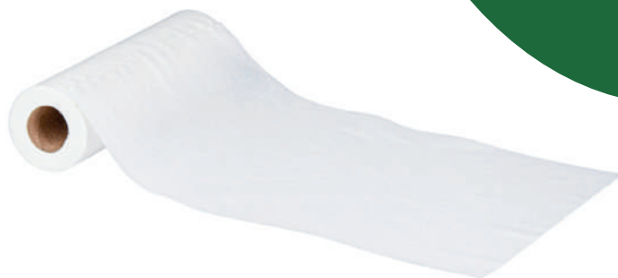
Clean Soft 40

Najczęściej stosowany jako wkład do nasączania i jako ręcznik fryzjerski.