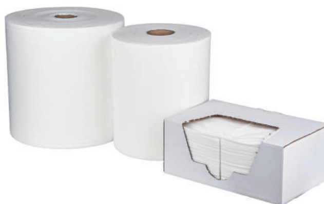
Clean Soft Hydro 65

Soft Hydro jest komponowane z włókien celulozowych, poliestrowych i polipropylenowych, dzięki czemu znajduje zastosowanie w zakładach gdzie dokładność i precyzja czyszczenia ma znaczenie. Gładka struktura powierzchni pozwala na szybkie i staranne zbieranie zanieczyszczeń płynnych. Jest miękkie i nie rysuje czyszczonej powierzchni. Splot włókien daje możliwość długotrwałego użytkowania czyściwa.