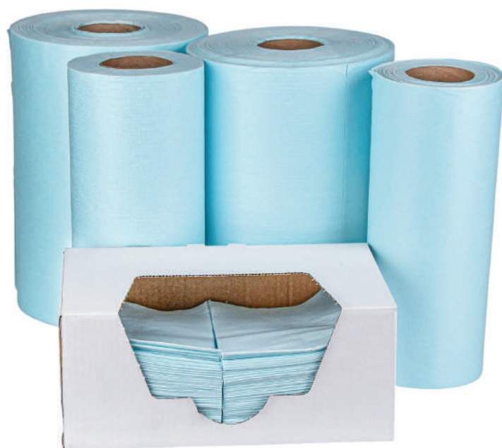
Clean Basic Plus Turkus